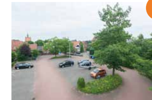
5 An den Schanzen