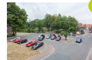
8 Pferdemarkt Für Busse geeignet