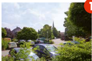
1 Höner Tor