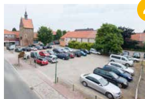
4 Hohes Tor